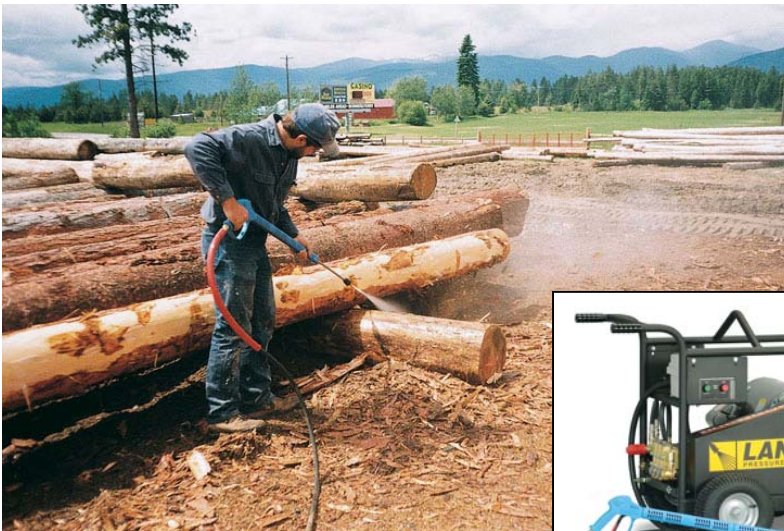
Arracher l'écorce des rondins est une des applications pour les laveuses haute pression MP ou MPE avec un pouvoir nettoyant jusqu'à 5000 PSI.