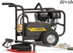
MP-373534 avec dévidoir en option

■ Pompe Landa haute pression, catégorie industrielle, entraînement par courroie, possédant une tête triplex, en laiton forgé avec une garantie limitée à vie et avec, première sur le marché, une garantie de 7 ans sur la partie de la pompe baignant dans l'huile.